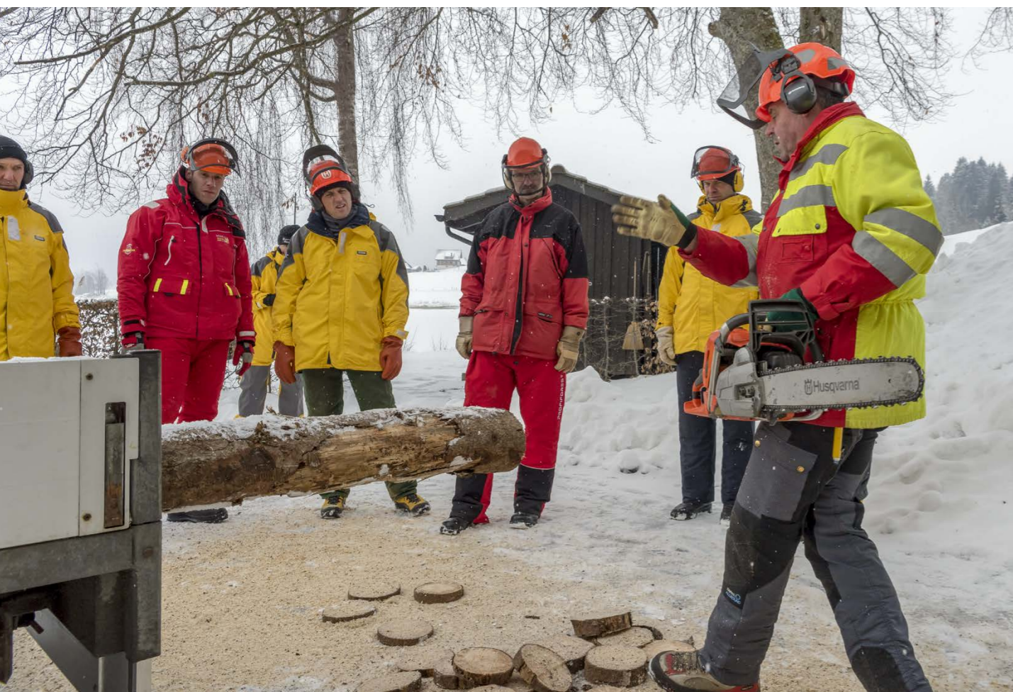
Des plongeurs de police du canton de Schwyz suivent un cours de maniement de la tronçonneuse de ForêtSuisse.

L'année sous revue a connu une nette augmentation des cours de base et de formation continue en bûcheronnage. La raison en est que ces cantons appliquent déjà le nouvel article de la loi sur les forêts concernant la formation minimale des personnes qui exécutent des travaux de récolte de bois. Il est plus inquiétant de constater que 60 apprentis forestiers-bûcherons de moins que l'année précédente se sont inscrits aux cours interentreprises. Certes, comme l'année scolaire ne correspond pas à l'année civile, il est normal d'observer certaines fluctuations dans les statistiques annuelles. Néanmoins, il convient de garder un œil sur ces chiffres.