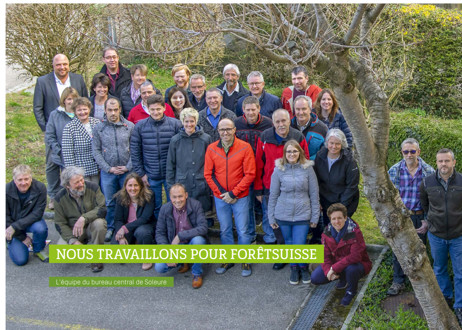
L'équipe du bureau central de Soleure

*Membre comité directeur Etat au 1 er avril 2019