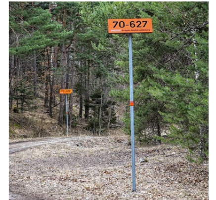
Tracé d'un gazoduc en forêt.

Après des tests pratiques approfondis, le nouveau programme ForstControl a été présenté à la Foire forestière de Lucerne. Il s'agit d'une application en ligne qui permet à toute l'équipe de collaborateurs, de l'apprenti au garde forestier, de saisir les heures de travail sur des appareils mobiles, projet par projet. Doté de différents modules pour les adresses, les mandats, les documents, les analyses, etc., ce programme est très polyvalent.