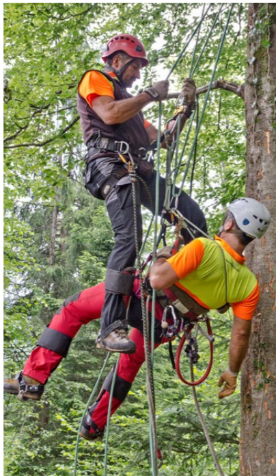
Exercice de sauvetage dans le cadre d'un cours de grimpe. Le matériel est l'objet de contrôles de sécurité réguliers.

pour les cours de formation continue technique de grimpe à la corde, cours pour formateurs, premiers secours destinés aux professionnels. Le film didactique de 2002 « Cas normal » a été refait et adapté à l'état actuel des techniques. Il sert d'introduction à la partie théorique de nombreux cours. Les contrats de formation ont été beaucoup plus nombreux dans les domaines extérieurs à la branche. Ainsi, des cours pour les CFF ont été organisés en 2017 pour la première fois depuis longtemps. Les effectifs ont de nouveau fortement augmenté aussi dans le service civil et la construction. Les