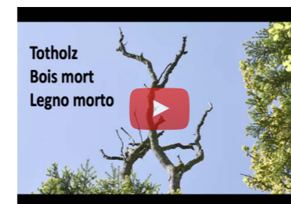
Notre court-métrage de sensibilisation aux risques du bois mort à été primé par le KWF.

La nouvelle « Solution de branche pour le secteur forestier » rencontre un franc succès. Fin 2016, quelque 350 exploitations publiques et 95 entreprises privées avaient acquis une licence. Environ 400 personnes ont suivi le cours d'une demi-journée sur cette Solution de branche. Par la suite, le marketing sera renforcé et les premiers cours de formation continue seront dispensés aux responsables de la sécurité en entreprise. La Solution de branche a son propre site internet www.branchenloesung-forst.ch .