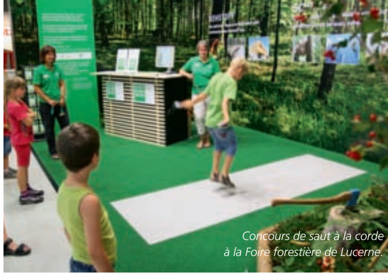
Concours de saut à la corde à la Foire forestière de Lucerne.