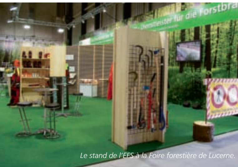
Le stand de l'EFS à la Foire forestière de Lucerne.