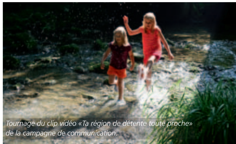
Tournage du clip vidéo «Ta région de détente toute proche» de la campagne de communication.