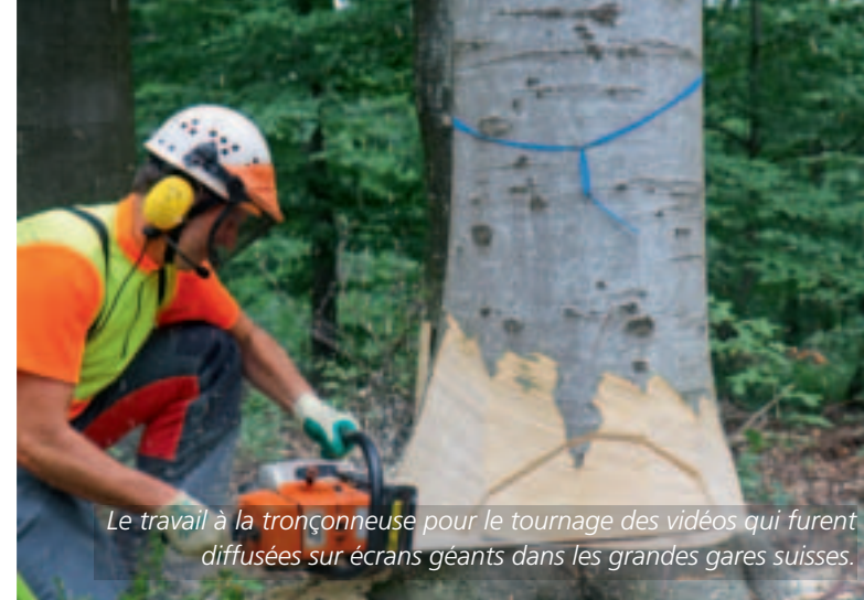
Le travail à la tronçonneuse pour le tournage des vidéos qui furent diffusées sur écrans géants dans les grandes gares suisses.