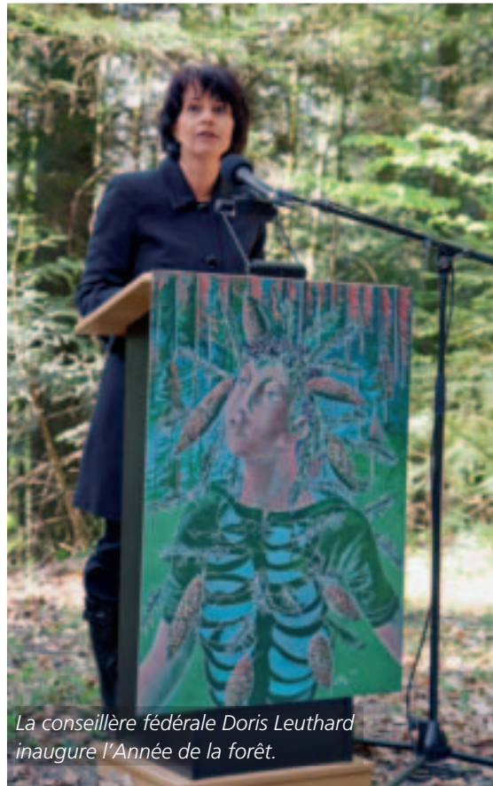
La conseillère fédérale Doris Leuthard inaugure l'Année de la forêt.