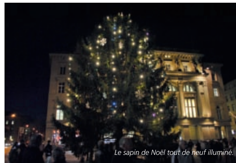
Le sapin de Noël tout de neuf illuminé.