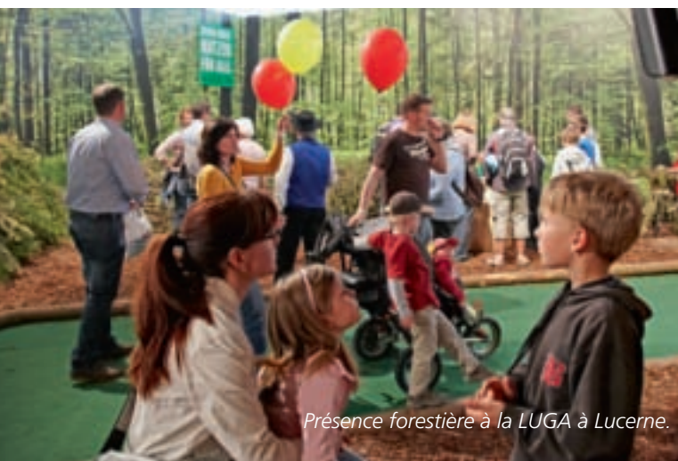
Présence forestière à la LUGA à Lucerne.