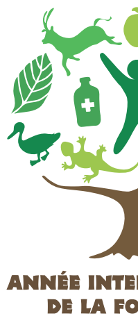
ANNÉE INTERNATIONALE DE LA FORÊT