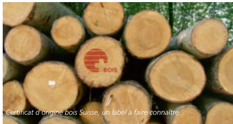
Certificat d'origine bois Suisse, un label à faire connaître.