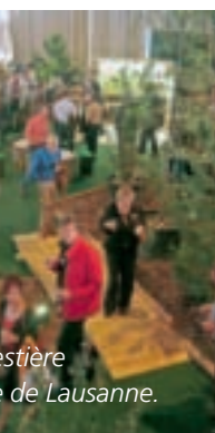
Parc de Lausanne.

INTERNATIONALE JOURNÉE INTERNATIONALE DE LA FORÊT • 2011