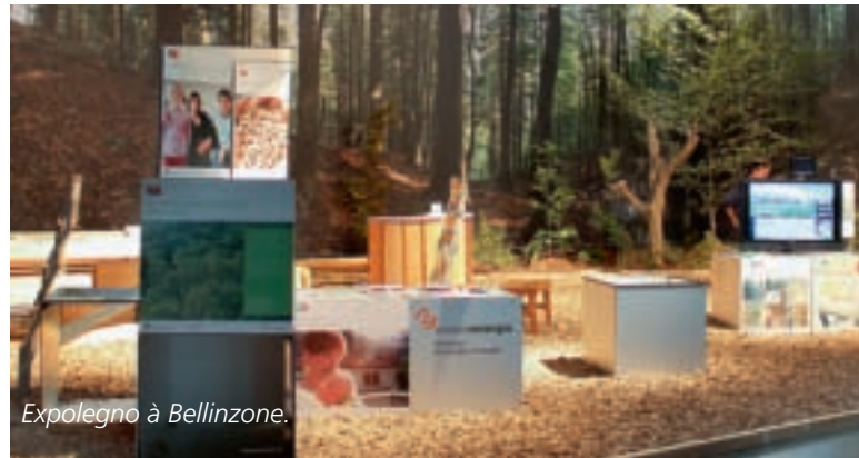
Expolegno à Bellinzona.