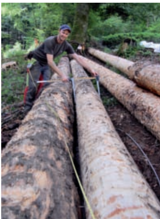
Cubage de bois avec chevillière et compas.

En automne 2012, nous pourrions passer à la diffusion active de la nouvelle version CEforestier 3.0. Dans les milieux informatiques, on s'attend à la sortie de Windows 8 pour l'été ou l'automne 2012. EFS-Economie va donc tester systématiquement la compatibilité des programmes qu'elle distribue afin d'éviter de mauvaises surprises à ses clients.