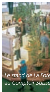
Le stand de La Forêt au Comptoir Suisse