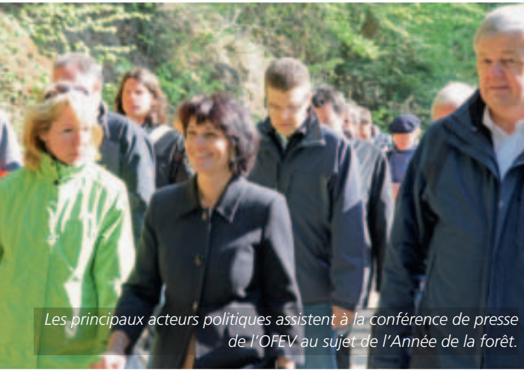
Les principaux acteurs politiques assistent à la conférence de presse de l'OFEV au sujet de l'Année de la forêt.