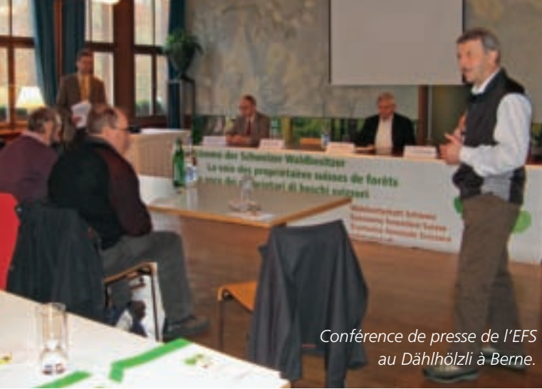
Conférence de presse de l'EFS au Dählhölzli à Berne.