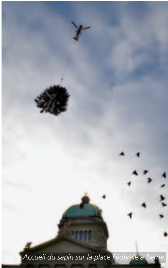
Accueil du sapin sur la place Fédérale à Berne.